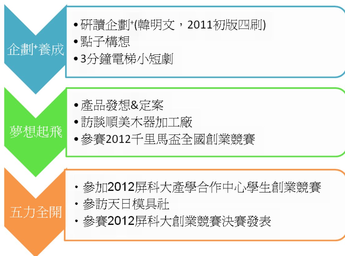
圖 1 百斯扣小組專題製作流程